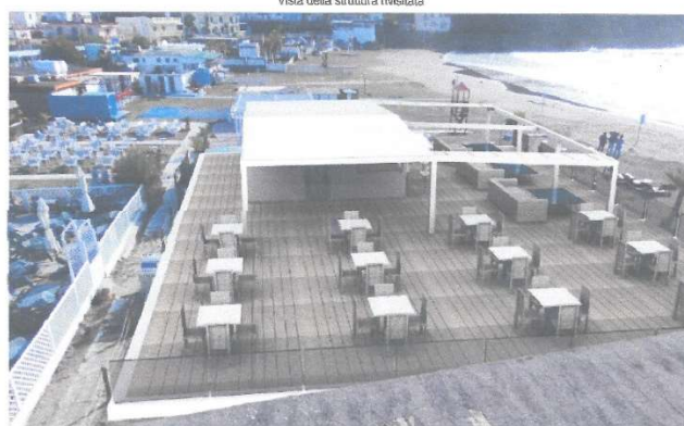
Vista della struttura rivisitata