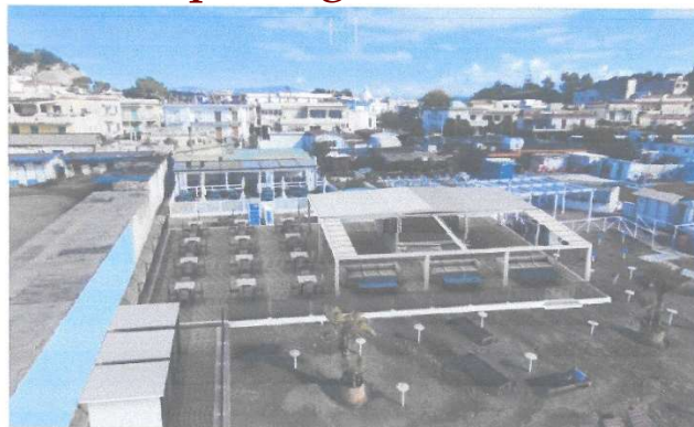
Vista della struttura rivisitata