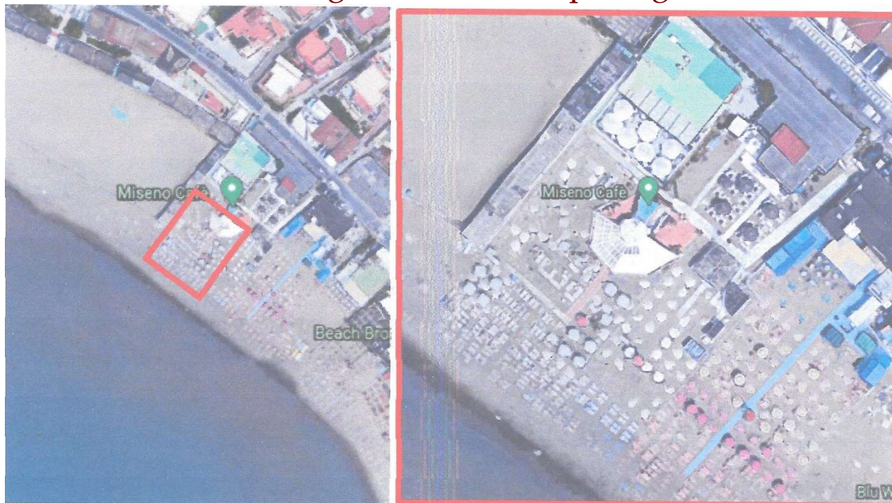
Stato attuale dell'area dove con particolare (riquadro rosso)