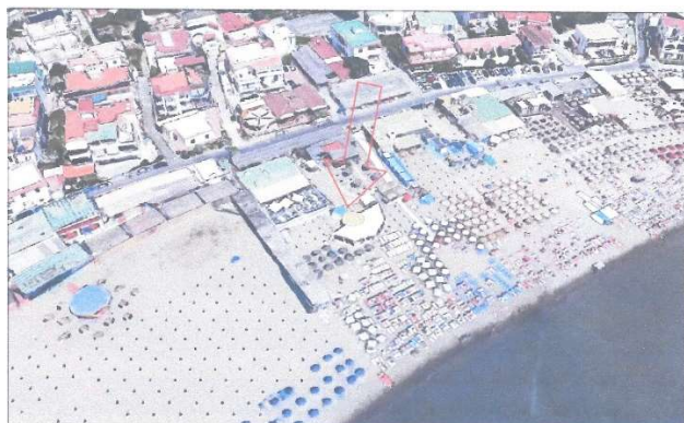
Vista della struttura attuale